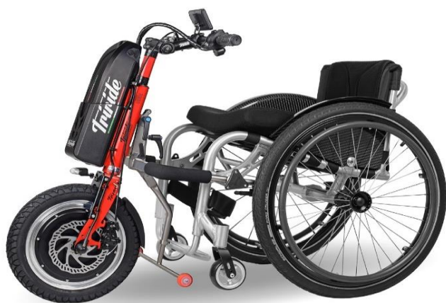
Roue 14" avec moteur intégré

Enregistrement des dispositifs médicaux N°: 1560510