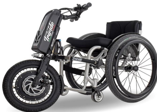
Roue 16" avec moteur intégré

Enregistrement des dispositifs médicaux N°: 1560514